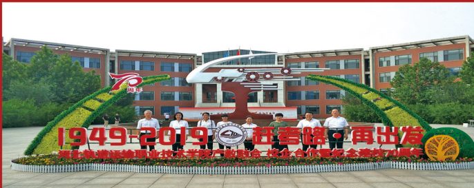
河北轨道交通职业技术学院产教融合校企合作暨纪念建校70周年（东校区）