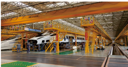
高铁动车组机电设备装配