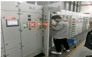
技术人员正在检查供电设备