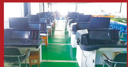
城轨车辆模拟驾驶教学功能区