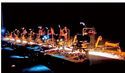
对高铁线路进行维保作业