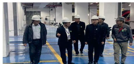
学院领导深入企业调研“新型学徒制”办学