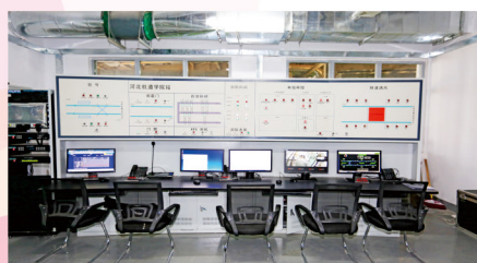
城轨车站车控室作业平台