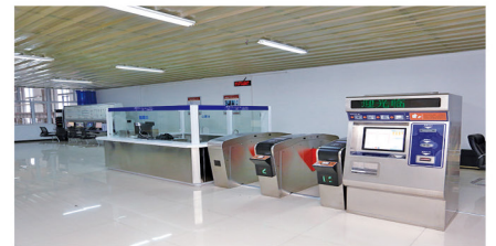
机电设备教学功能区