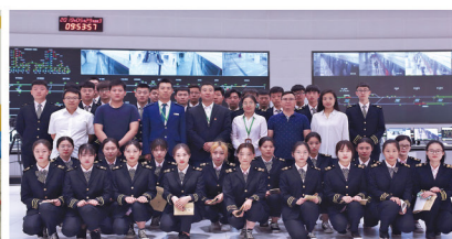
国家教育部城轨运营专业现代学徒制试点取得圆满成功