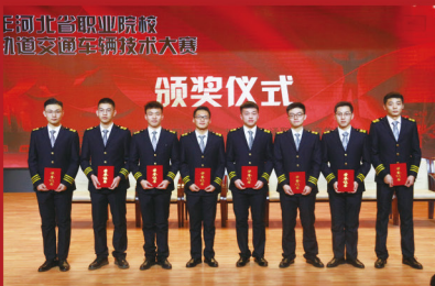
参加河北省职业技能大赛硕果累累