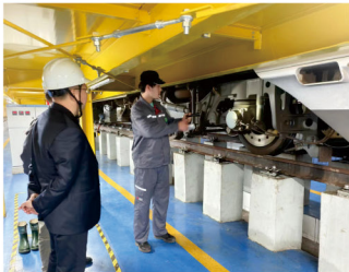
铁道机车车辆转向架检修