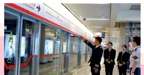
城轨车站站台运营作业