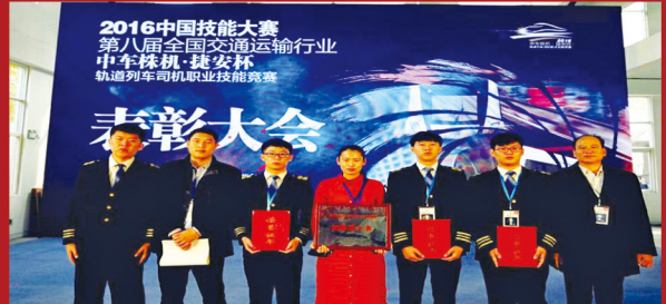
参加2016中国职业技能大赛获得全国职业院校第六名