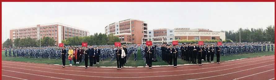
承办河北省城轨车辆专业职业技能大赛