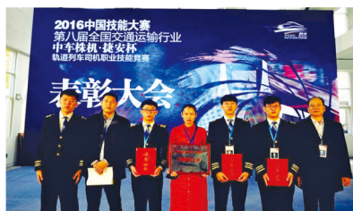
参加2016、2019中国职业技能大赛跻身全国前十名