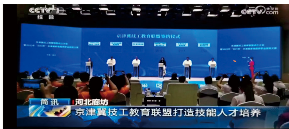
学院牵头组建京津冀技工教育联盟，助推技工教育高质量发展

河北省技师学院 HeBei Province Technician Institute