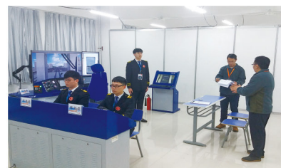
学生组参加2019中国职业技能大赛荣获全国第六名