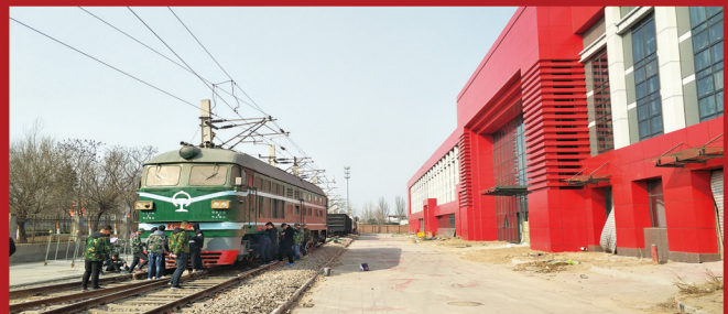
河北省技师学院传家宝专业-内燃机车