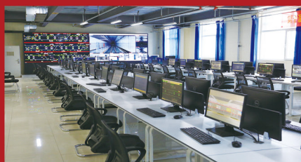
城轨交通运营教学功能区