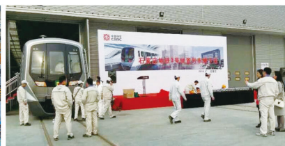
50名学生参与石家庄地铁首列城轨列车生产制造