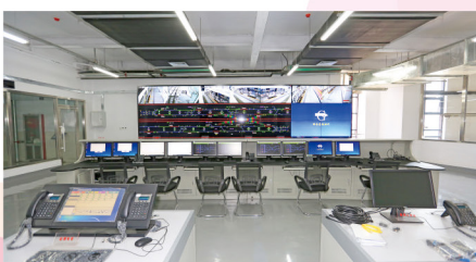
城轨交通运营OCC中心