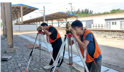
铁路工程技术人员正在进行勘察测量作业