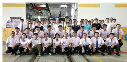
国家教育部城市轨道交通专业现代学徒制试点取得圆满成功