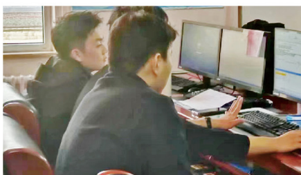
制定铁道线路养护施工方案