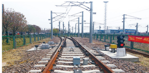
电气化铁道供电教学功能区