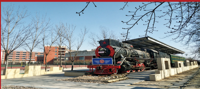
河北省技师学院传家宝专业-蒸汽机车