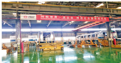
学徒工在我国一流企业开展工学结合项目