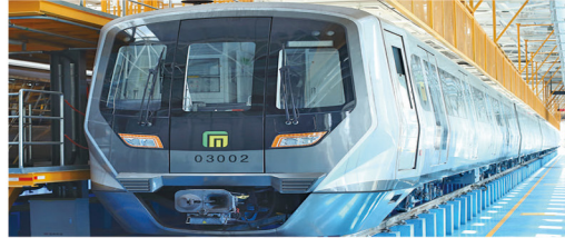
城市轨道交通列车