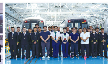
城轨车辆专业现代学徒制试点班学生在企业