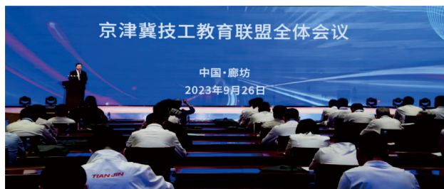
学院当选为京津冀技工教育联盟理事长单位，理事长在成立大会上致辞